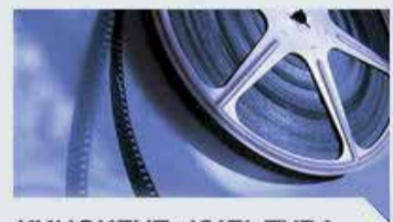
КИНОКЛУБ: КУЛЬТУРА, ОБРАЗОВАНИЕ, КОММУНИКАЦИИ

Цель проекта - сделать «важнейшее из искусств» доступным для жителей малых населенных пунктов, дать возможность всем ставропольчанам смотреть хорошее, новое и ставшее классикой кино, разнообразить их досуг.